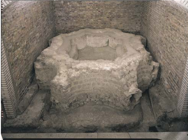
Die Piscina östlich des Domchores – letzter Rest der Kirchenanlage des 6. Jh. n. Chr.

Zweitens: die Infrastruktur der Stadt, Straßen und Abwassersystem, wurde auch noch im späten 4., ja sogar noch im 5. Jh., erneuert, nachdem die letzten staatlichen römischen Autoritäten das Rheingebiet verlassen hatten. 29 Fränkische Könige übernahmen die Stadt und ließen sich im Praetorium nieder.